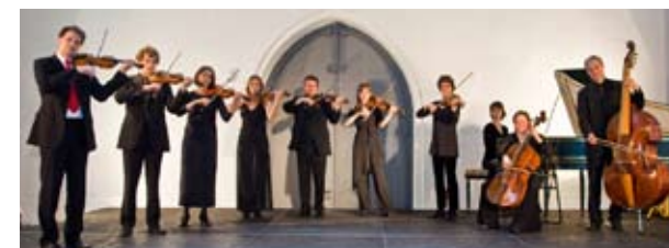
Das Main-Barockorchester

Werke von Friedrich dem Großen, Johann Joachim Quantz, Franz Benda, Carl Heinrich Graun und Christoph Schaffrath