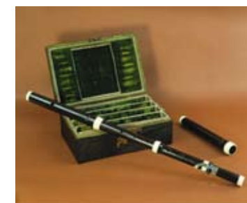
Traversflöte von Johann Joachim Quantz aus dem Besitz von Friedrich II.

Auf seinem berühmten Gemälde »Das Flötenkonzert Friedrichs des Großen in Sanssouci« aus den Jahren 1850 bis 1852 fängt Adolph Menzel im historischen Rückblick eine Situation ein, die typisch war für jene musikalischen Soireen, an denen der Preußenkönig höchstpersönlich als Flötist Anteil nahm und dabei das Geschehen mit eigenen Kompositionen bestimmte. Sein Lehrer Johann Joachim Quantz hielt sich meist vornehm zurück, so dass sich alle Augen auf den großen Monarchen richten konnten. Quantzens Anteil an Friedrichs Kompositionen lässt sich heute nur schwer bestimmen. Wir wissen aber, dass auf seine spezielle Anweisung hin die Traversflöten für Friedrich oft mit Dis- und Es-Klappe und Stimmzug gebaut wurden, und dass er die Organisation der täglichen Konzerte überwachte. Begleitet wurde Friedrich vom engsten Zirkel seiner Hofkapelle, von Carl Philipp Emanuel Bach am Cembalo und von Franz Benda mit der Violine. Somit erlauben die Flötenkonzerte aus der Feder Friedrichs II. einen unmittelbaren Einblick in die allabendliche Klangwelt im Musikzimmer zu Sanssouci.