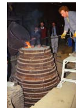
Veranstaltet von CarillonConcertsBerlin in Zusammenarbeit mit dem Staatlichen Institut für Musikforschung Berlin und mit Förderung des Hauptstadtkulturfonds

Anschließend Konzerte auf dem Carillon im Tiergarten (26., 27., 28. Mai ab 14 Uhr)